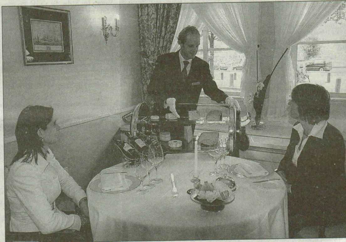
■ Gasten van Vermeer krijgen een heerlijk kaasdessert voorgeschoteld.

Gevolgd door Schotse zalm met nori. De vis gevuld met peterselie, kervel, bieslook, peper, zout en een beetje dille, ingepakt in het beroemde Japanse zeewier, gegaard op lage temperatuur en enkele dagen koud weggezet om de natuurlijke gelatines in het vlees te laten stollen. Een mootje daarvan, ongelooflijk zacht en