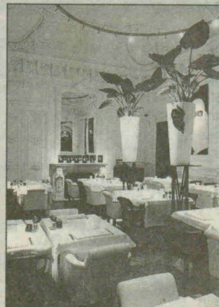
■ Cospaia: internationale

De locatie is niet zomaar gekozen: menig Europeaan kent deze plek van haar legendarische eetgelegenheden, een buurt die luxe en gezelligheid uitademt met exclusieve boetieks en hotels, vlakbij het financiële centrum, de