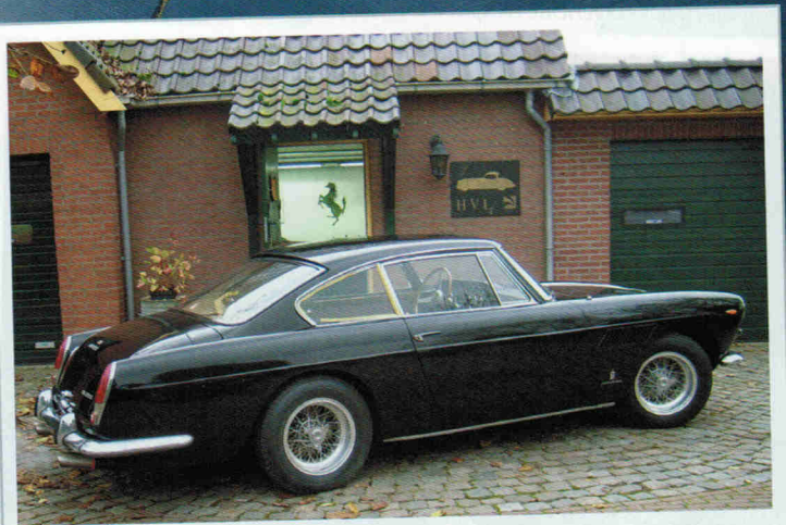
Ferrari 330 America uit de jaren '60.