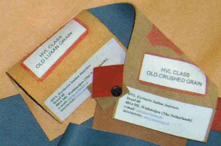
HVL Leather Sample.